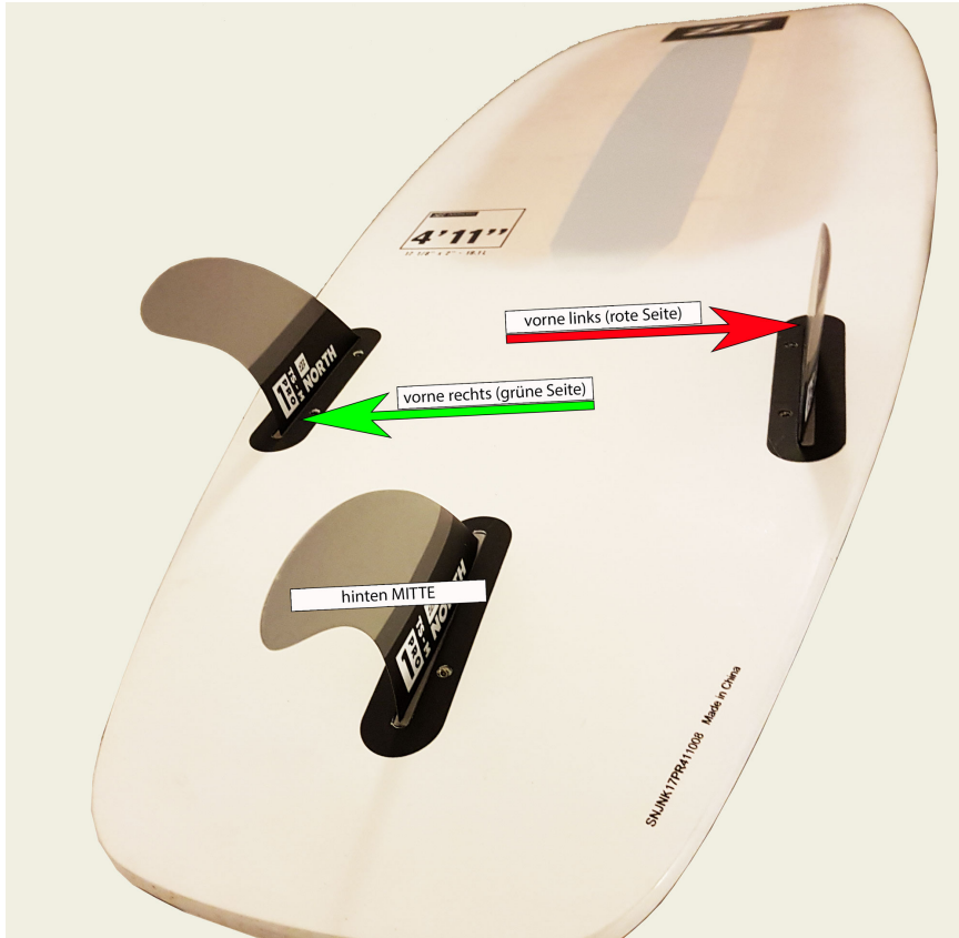
Drei Finnen - Thruster Setup

Es gibt vordere und hintere Finnen. Je nachdem von wo man auf das Surfboard schaut, kann man es linke oder rechte Seite nennen. Das Tail (Heck) des Boards hat in jedem Fall die hintere(n) Finne(n) und Richtung Nase (Spitze) sind die vorderen. Kitesurfboards werden meist mit drei oder vier Finnen gefahren. Man spricht von einem Thruster-Setup (drei Finnen) oder einem Quad-Setup (vier Finnen):